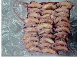
⑤加熱前 真空パック写真