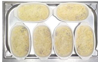
⑤加熱前 ホテルパン写真