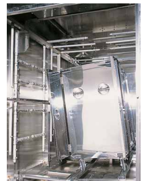
同一エリアで、洗浄・すすぎ・乾燥を、コンテナを傾斜させて効率良く行います。