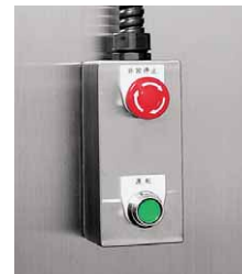
非常停止スイッチ (パッチタイプ用)