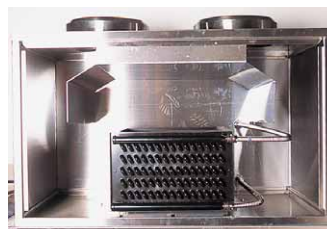
除湿排気装置 (コンベアタイプ用)

コンテナの洗浄は手洗いでは手間と時間が掛かり、衛生面での不安も残ります。マルゼンのコンテナ洗浄機シリーズは、高圧ポンプと独自設計の高圧高流量ノズルによる洗浄湯で一気に強力にすすぎまで洗い上げ、しかもすすぎ後には熱風による水切りまで行うので、面倒な作業を軽減できます。厨房環境を改善する除湿排気装置を標準装備し、また、マイコンコントロールによる簡単な操作性や、パトライト、非常停止装置など安全性能も充実しています。