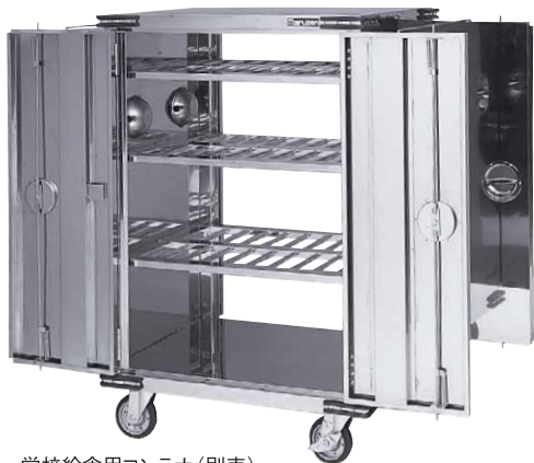
学校給食用コンテナ (別売)